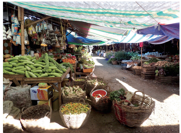
図1. 所狭しと雑多なものが並べられた市場の様子

これほど素朴なボトルに入ったはちみつは初めてだったので、フィリピンの人たちの暮らしを思い描きながら、眺めていたのですが、帰国後一か月たっても一向に固まる気配がないのです。ふつうはちみつと言ったら、寒い冬には結晶化が進み、スプーンでガリガリ削って食べなければいけないのですが…。もしや「混ざりもの入りのはちみつ」