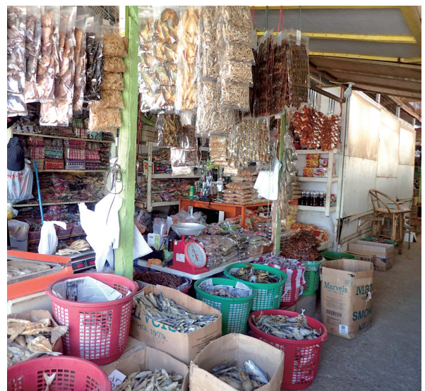
図2. 棚の奥にひっそりと売られたはちみつ