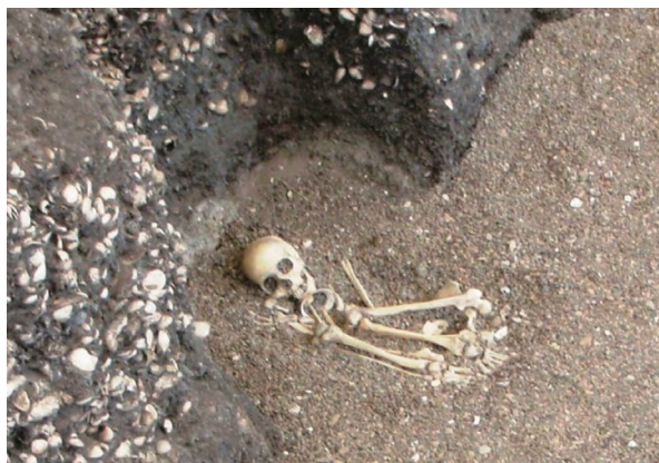
図 1. 吉胡貝塚から出土した人骨（復元模型）

した個体を検出することが可能であることを示唆しています。地球研には、Sr 同位体比を測定することのできる大型の装置があり、これを利用して古人骨のストロンチウム同位体分析を行うことにしました。